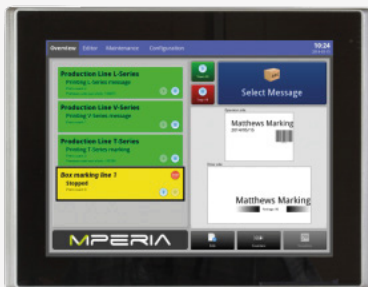
MPERIA 12" Évolué