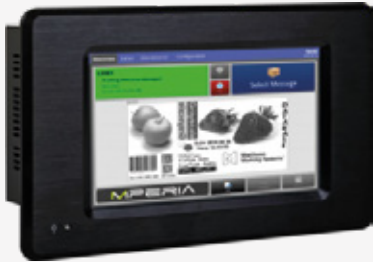
MPERIA 7" Lite