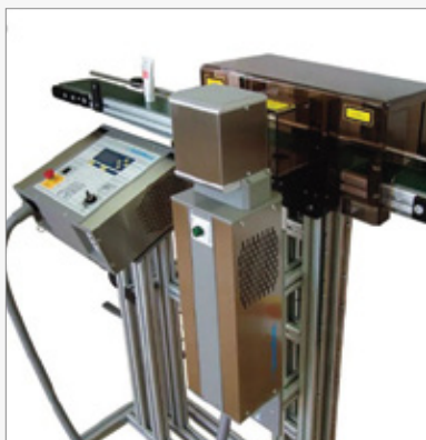
eSOLARMARK CO 2 Convoyeur